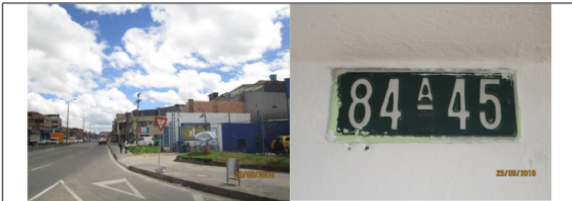
VISTA PANORÁMICA Y DE LA PUBLICIDAD AVENIDA CALLE 67 No.84 A - 45 SENTIDO SUR – NORTE